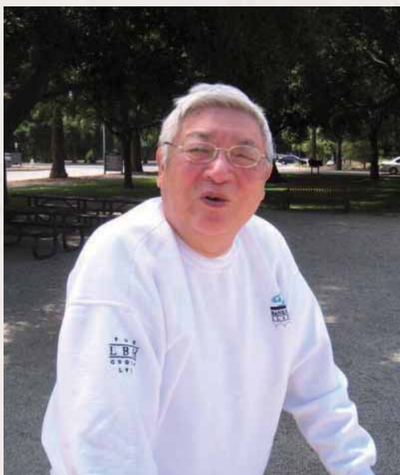
二一一年六月於美國史丹福大學校園