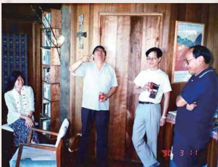
一九九一年三月於夏威夷為友人及同事歌唱

一九六八年陶先生受聘到夏威夷大學歷史系任教，開始了在夏大長達三十一年教學生涯，並成為夏大歷史系的終身教授。陶先生的學術研究重點是中國漢代歷史及古代官制，特別是前漢王朝的人事制度，以及東亞古代史。陶先生曾開設多種本科與研究生課程，包括遠東文明史、中國古代史（漢初至唐中期）、中國史料學，撰寫了《日本信史的開始》專書和多篇學術論文，並指導碩博士生