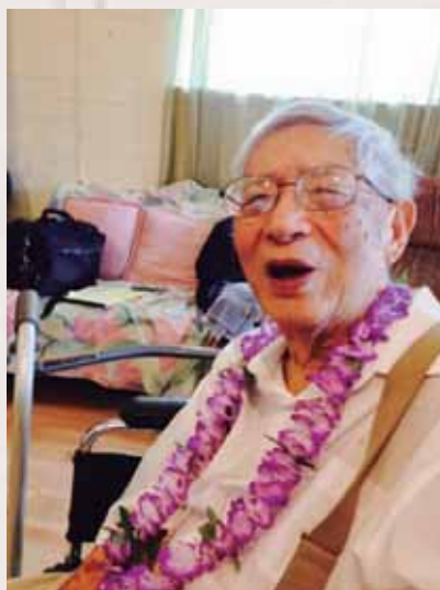
二一〇四年八月於美國加州紅木城