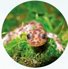
臺灣山椒魚( Hynobius formosanus )為臺灣特種，分布於3,000公尺以上的高山。此種後肢具5趾，過去與楚南氏山椒魚( H. sonani )學名錯置，2021年已有文獻發表將兩者學名進行勘正。